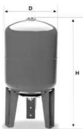
SPTS (80, 100л)